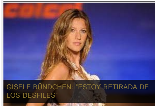
GISELE BÜNDCHEN: "ESTOY RETIRADA DE LOS DESFILES"