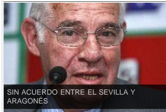
SIN ACUERDO ENTRE EL SEVILLA Y ARAGONÉS